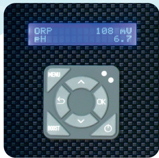
LCD-Display und Touchpad